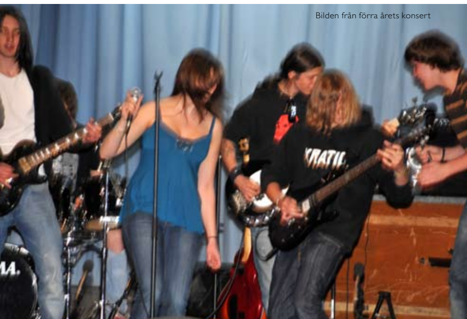
Bilden från förra årets konsert